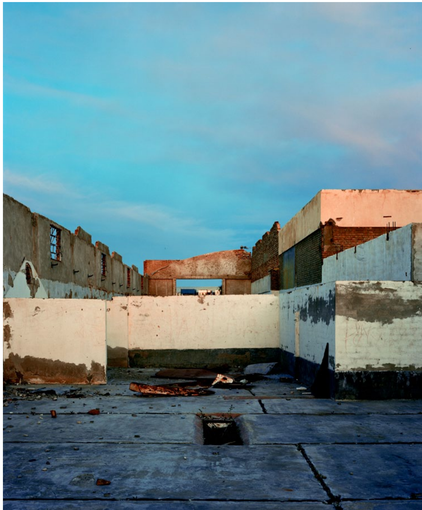
San Antonio Oeste # 003 - 2011 Patagonia Argentina, 2011