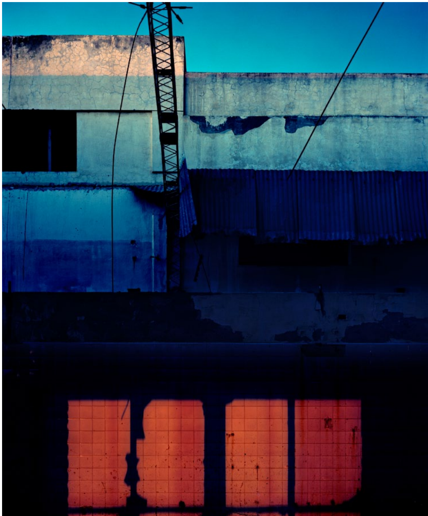
San Antonio Oeste # 002 - 2011 Patagonia Argentina, 2011