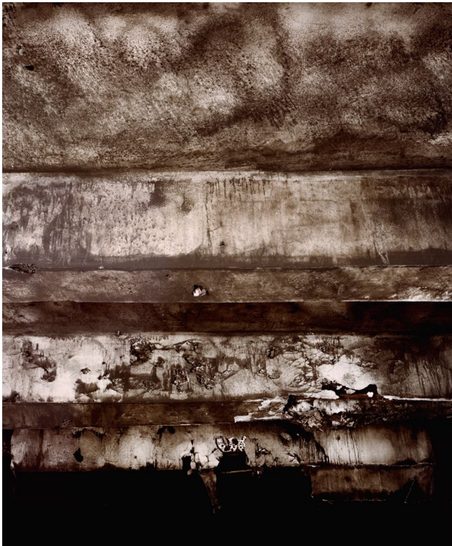
San Antonio Oeste # 012 - 2011 Patagonia Argentina, 2011