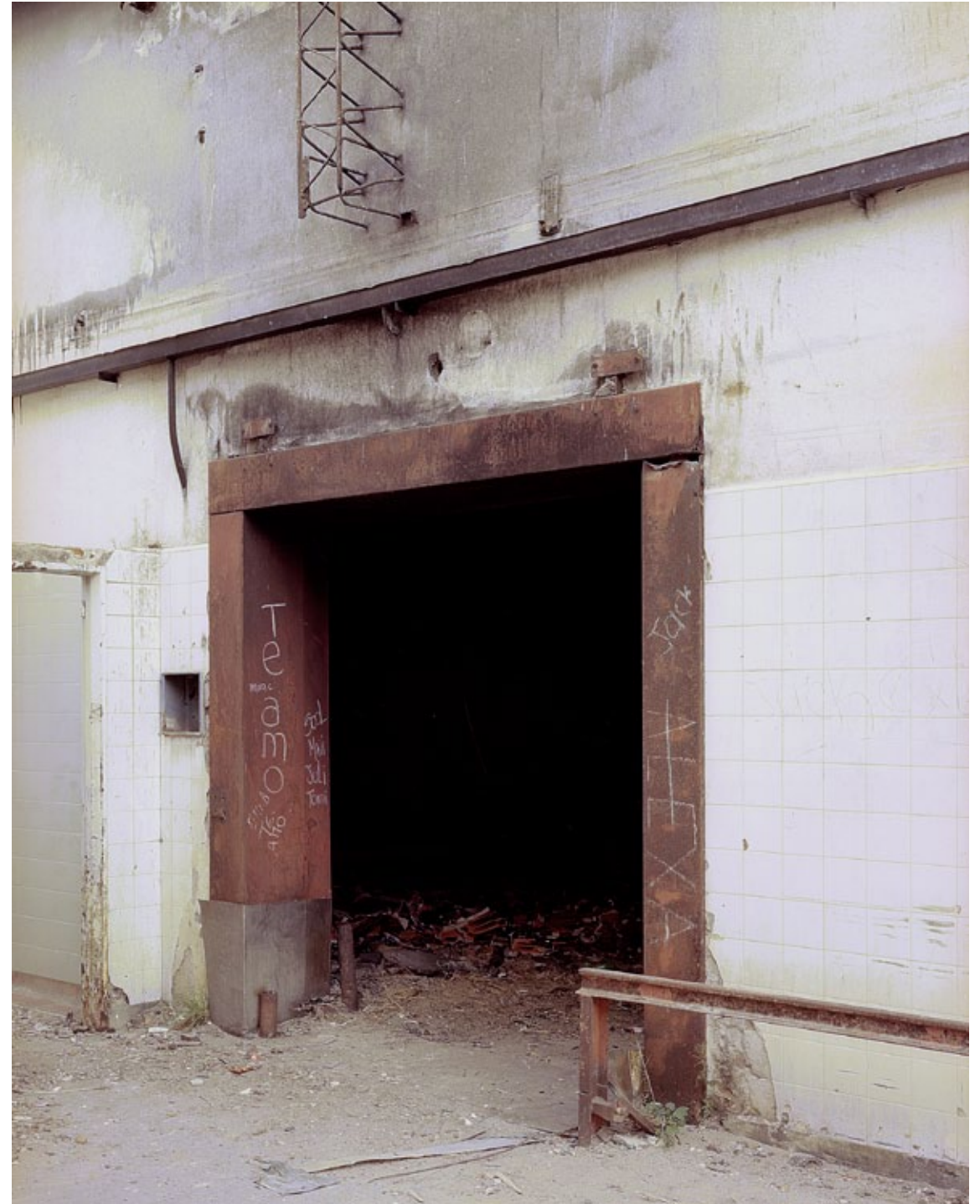
San Antonio Oeste # 019 - 2011 Patagonia Argentina, 2011