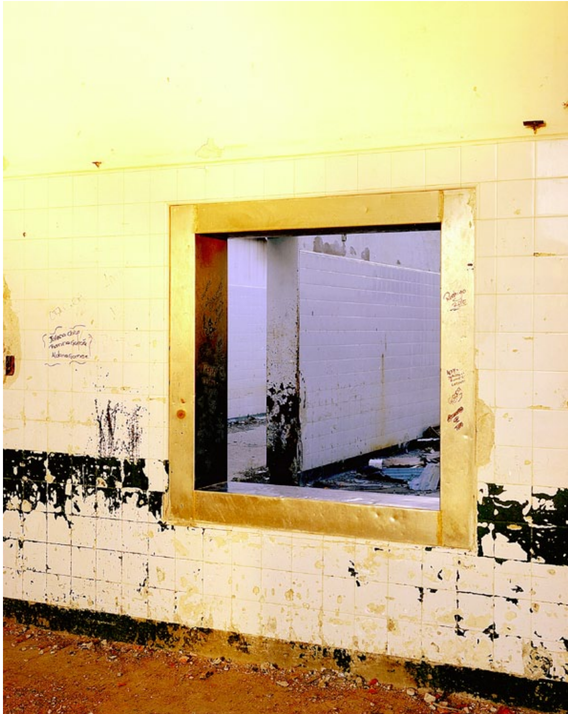
San Antonio Oeste # 022 - 2011 Patagonia Argentina, 2011