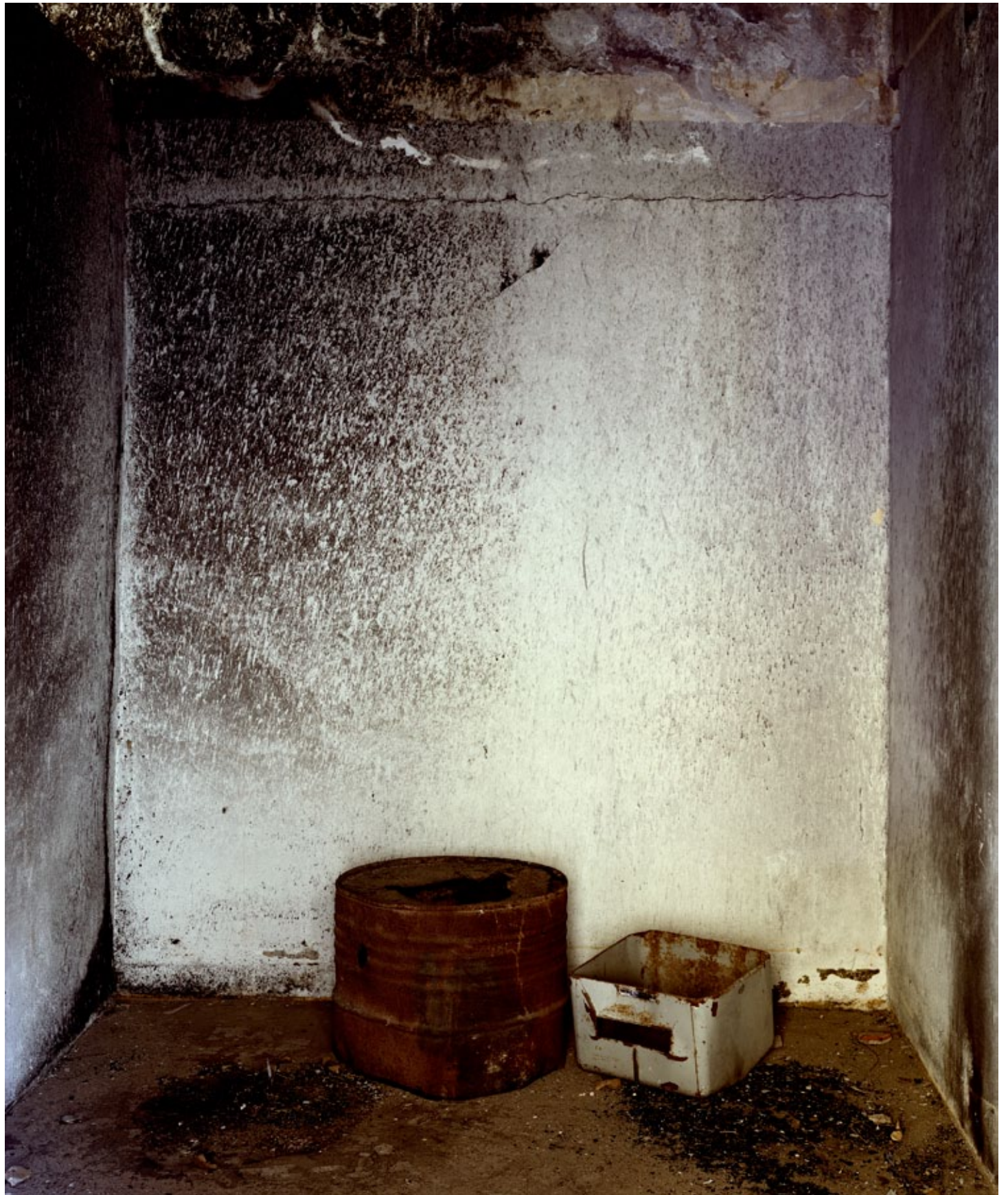
San Antonio Oeste # 009 - 2011 Patagonia Argentina, 2011