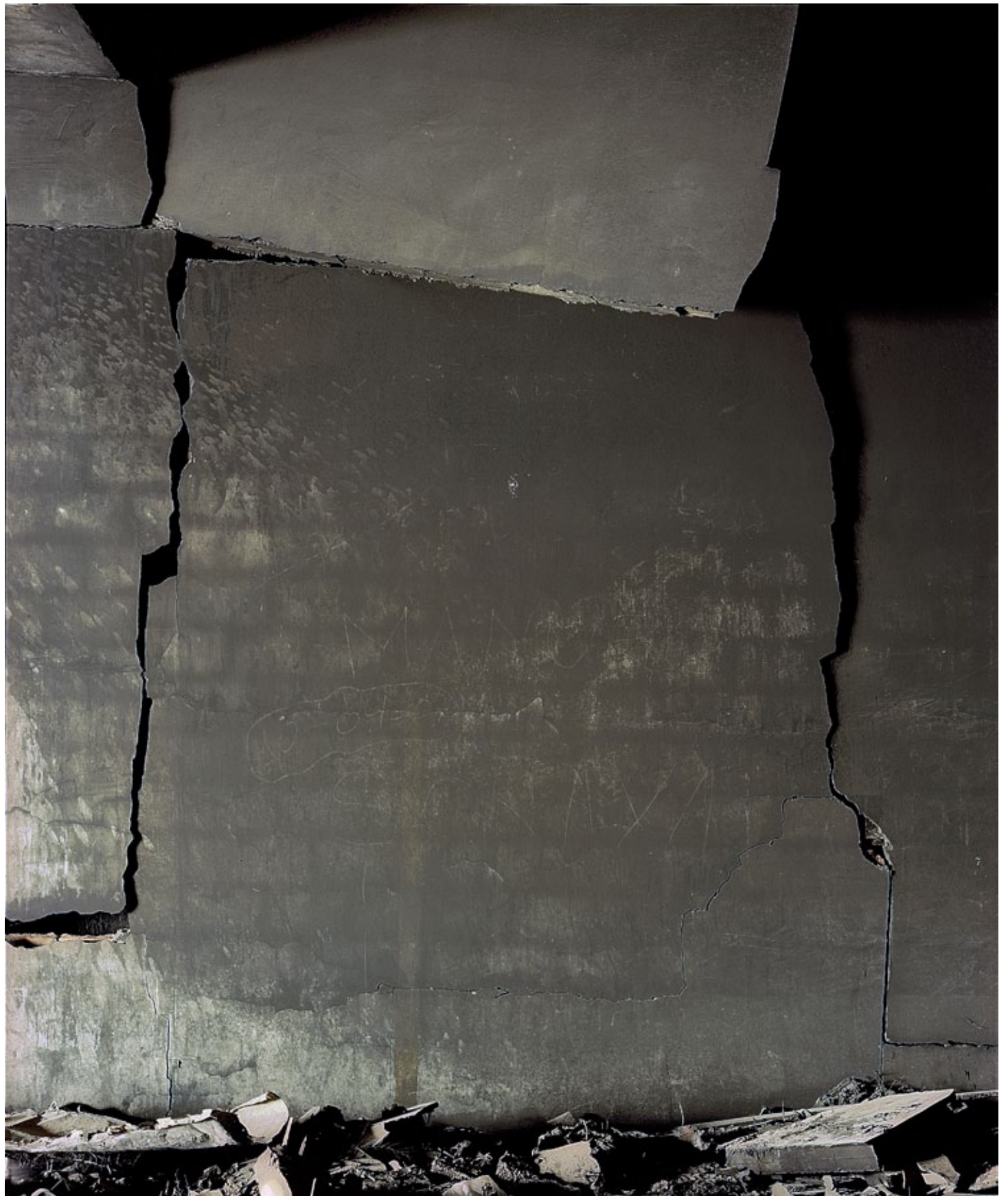
San Antonio Oeste # 017 - 2011 Patagonia Argentina, 2011