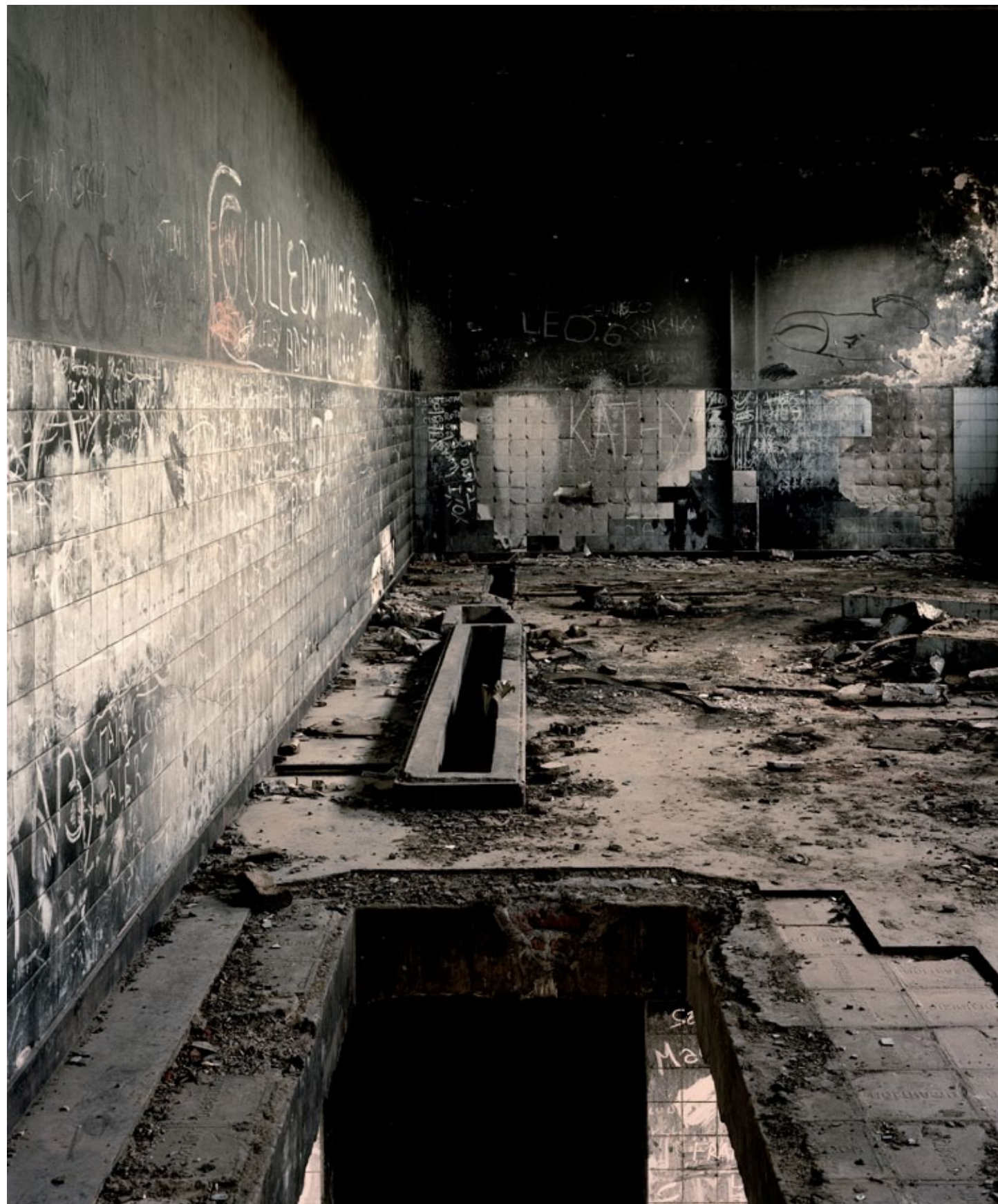
San Antonio Oeste # 005 - 2011 Patagonia Argentina, 2011