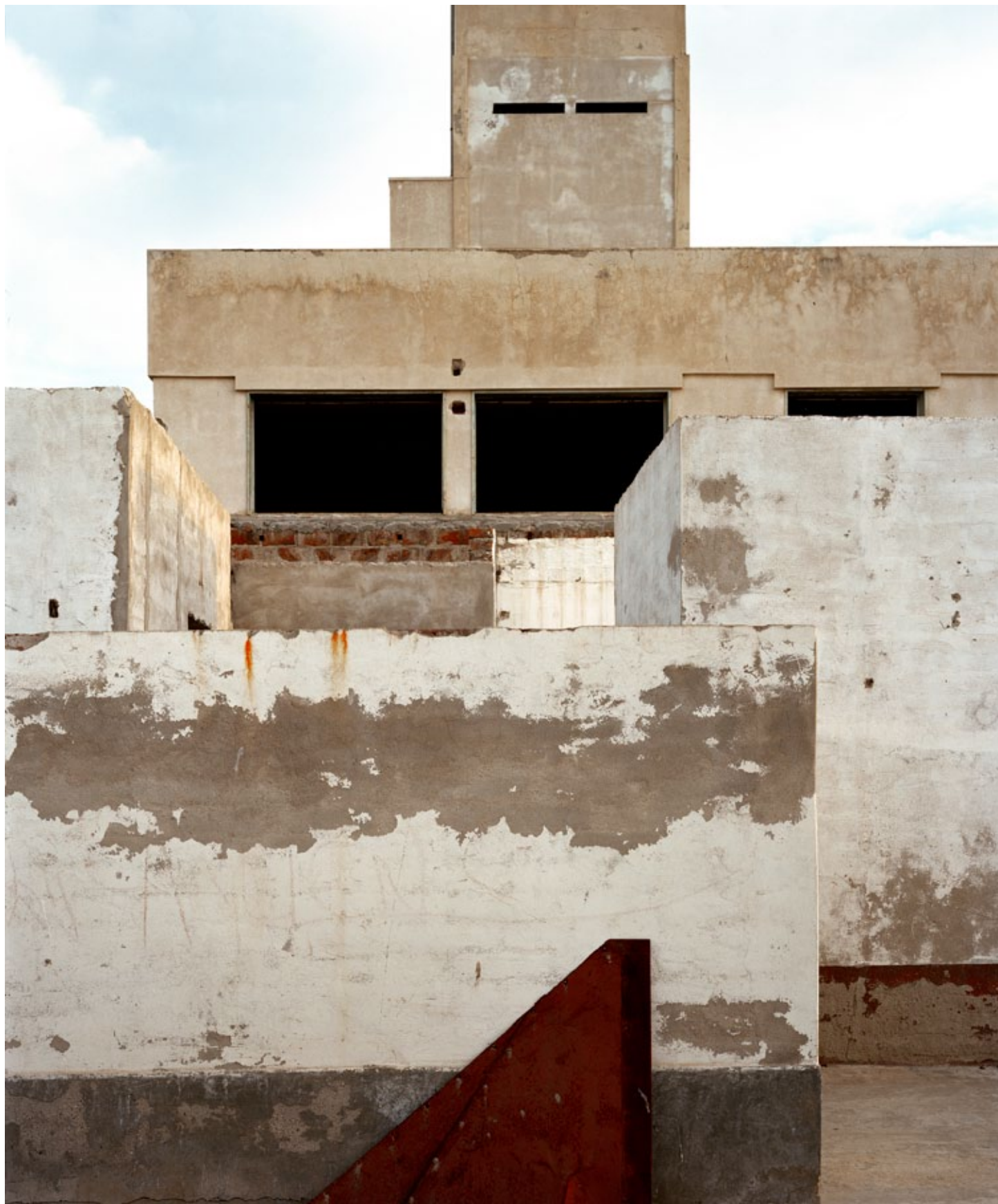
San Antonio Oeste # 004 - 2011 Patagonia Argentina, 2011