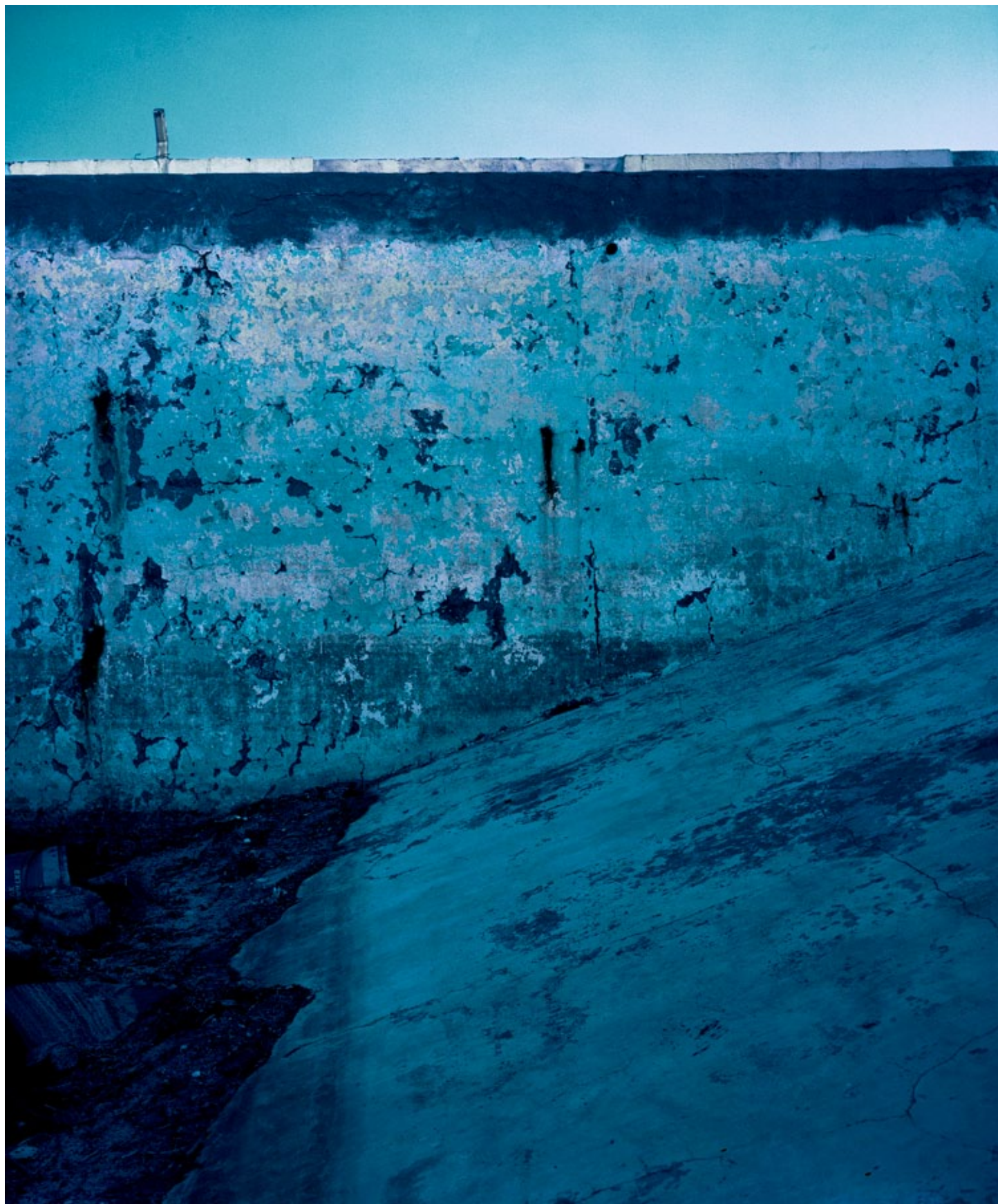
San Antonio Oeste # 025 - 2011 Patagonia Argentina, 2011