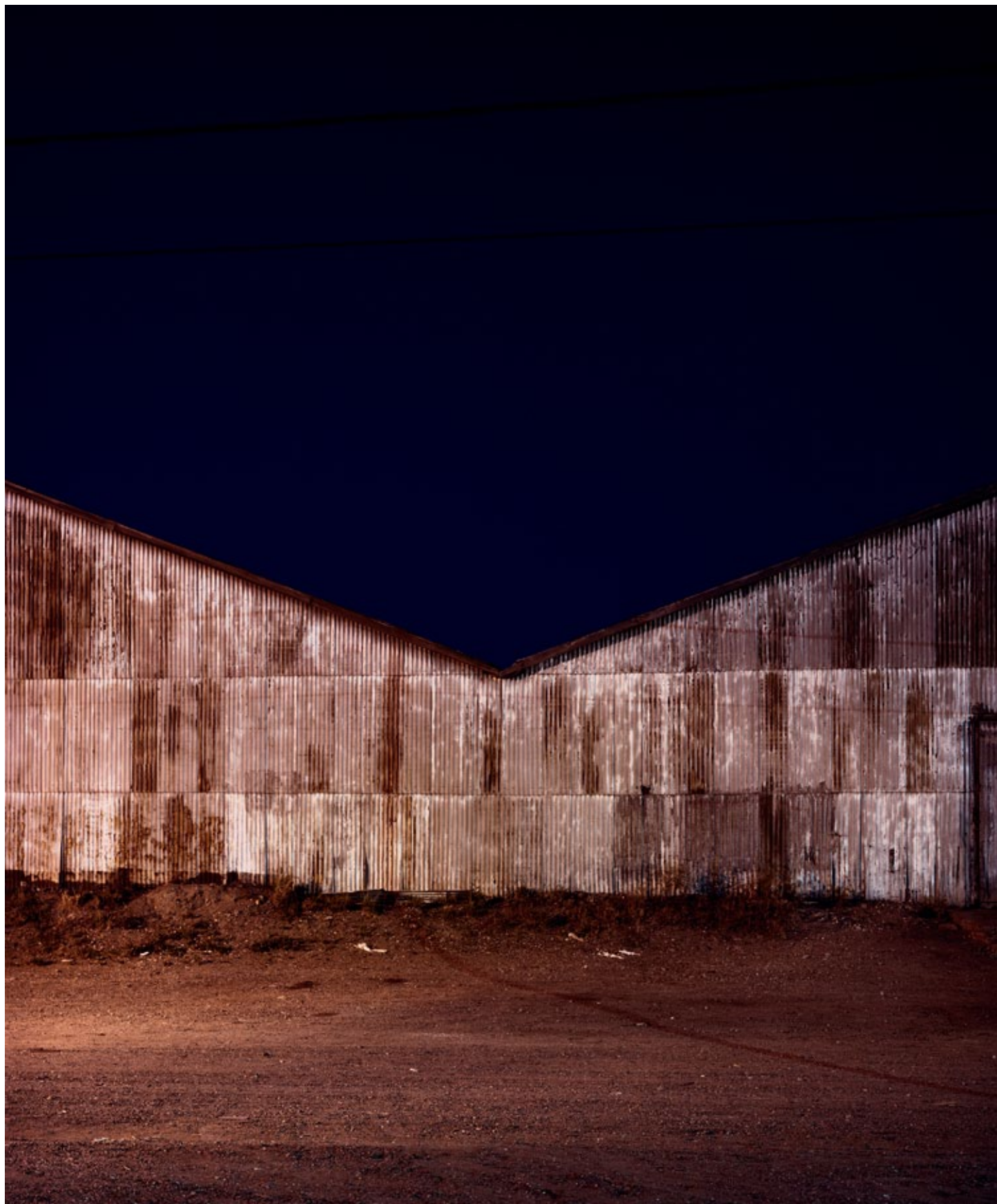
San Antonio Oeste # 001 - 2011 Patagonia Argentina, 2011