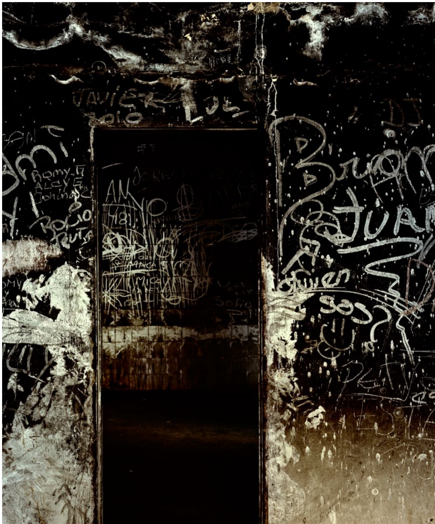
San Antonio Oeste # 007 - 2011 Patagonia Argentina, 2011