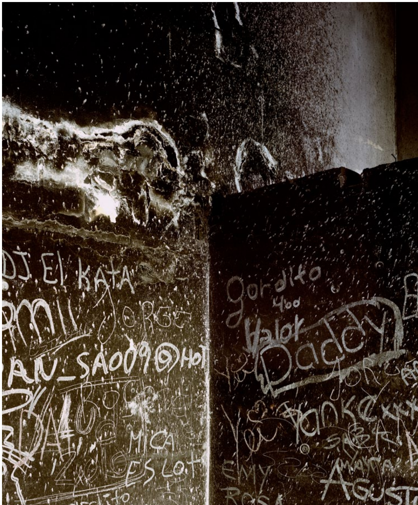
San Antonio Oeste # 006 - 2011 Patagonia Argentina, 2011