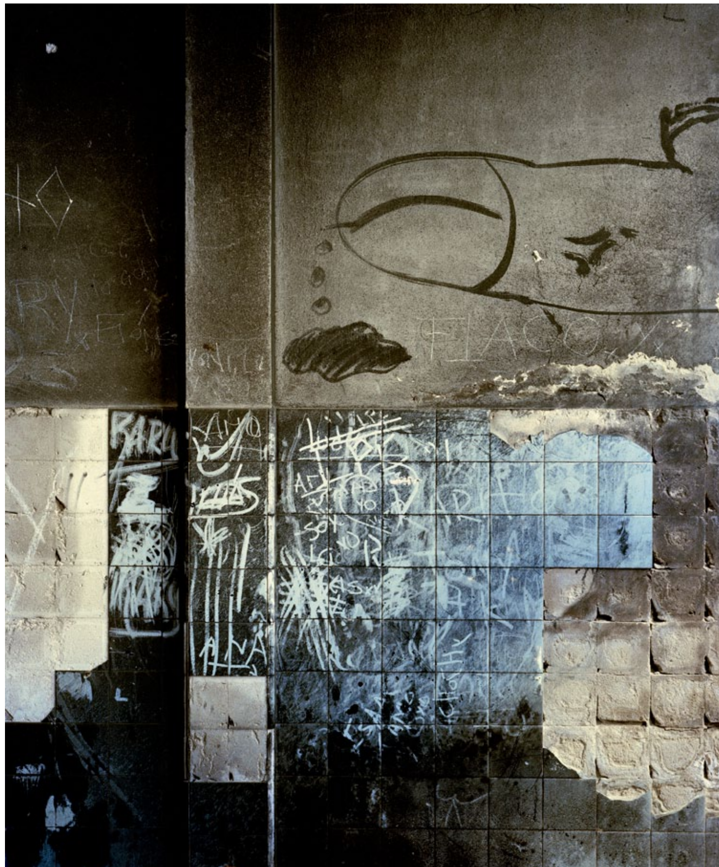
San Antonio Oeste # 013 - 2011 Patagonia Argentina, 2011